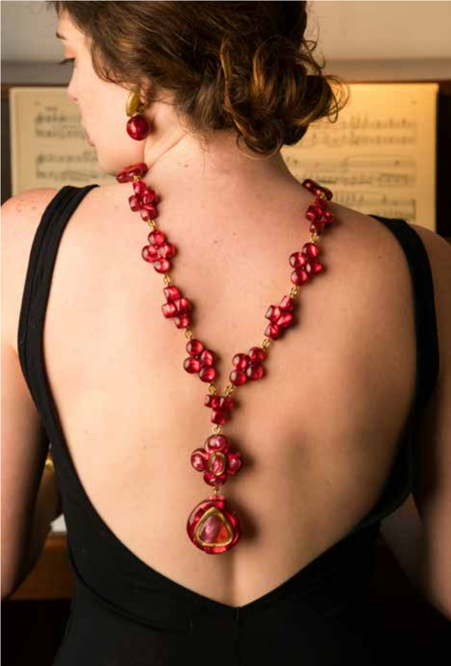
Earrings Clementina / Necklace Lucy