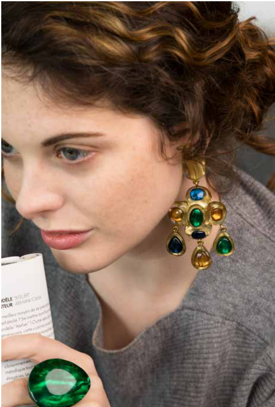
Earrings Tia / Ring Milley