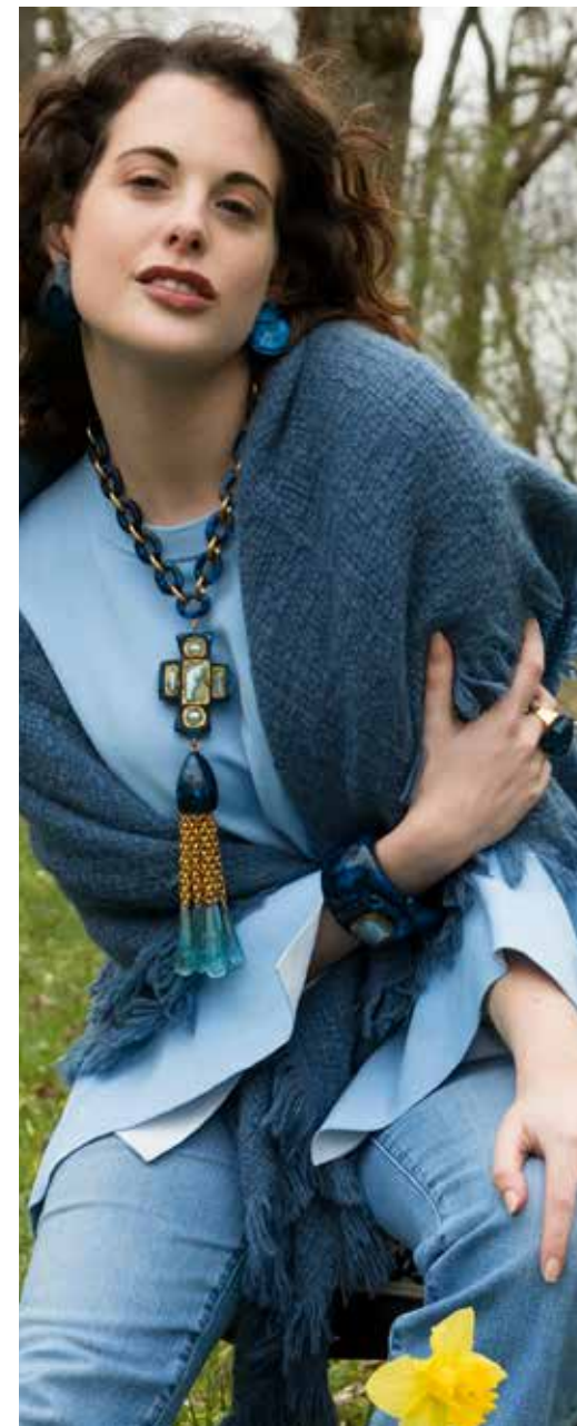
Earrings Milley / Necklace Blanche / Bracelet Yuri / Ring Everly