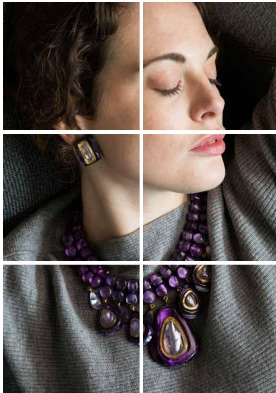
Earrings Ciela / Necklace Laurette