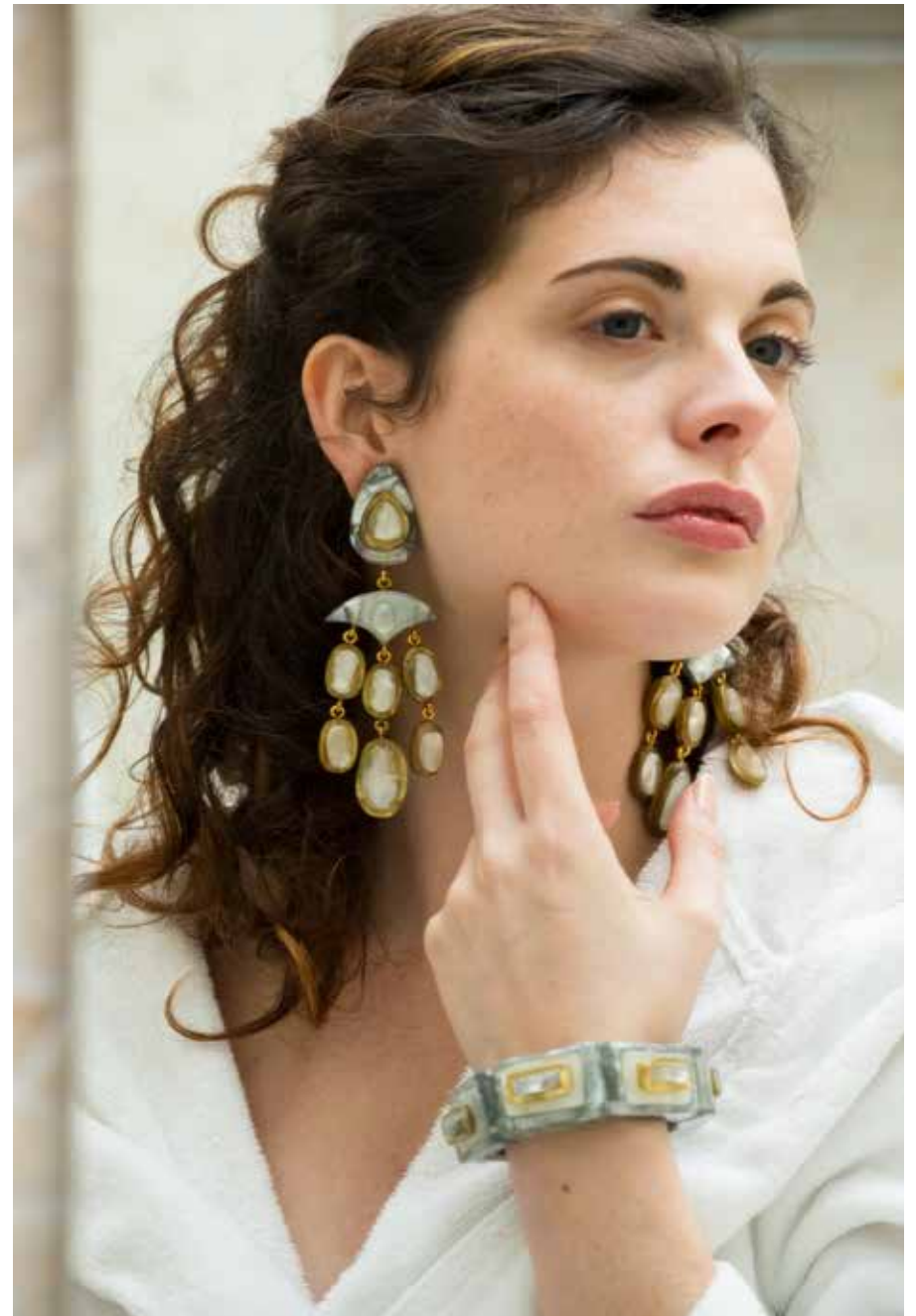
Earrings Leonie / Bracelet Malia