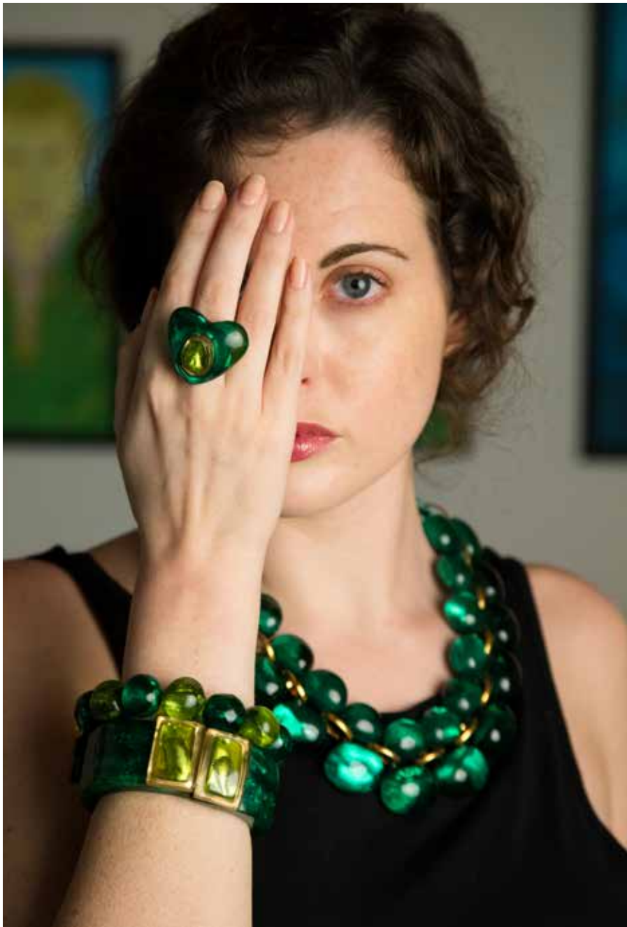
Ring Polly / Necklace Andrea / Bracelet Mara & Raquel