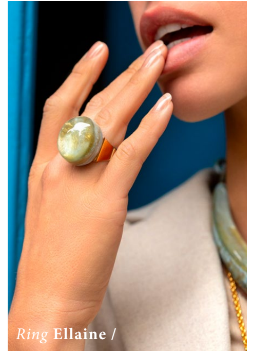
Ring Ellaine /