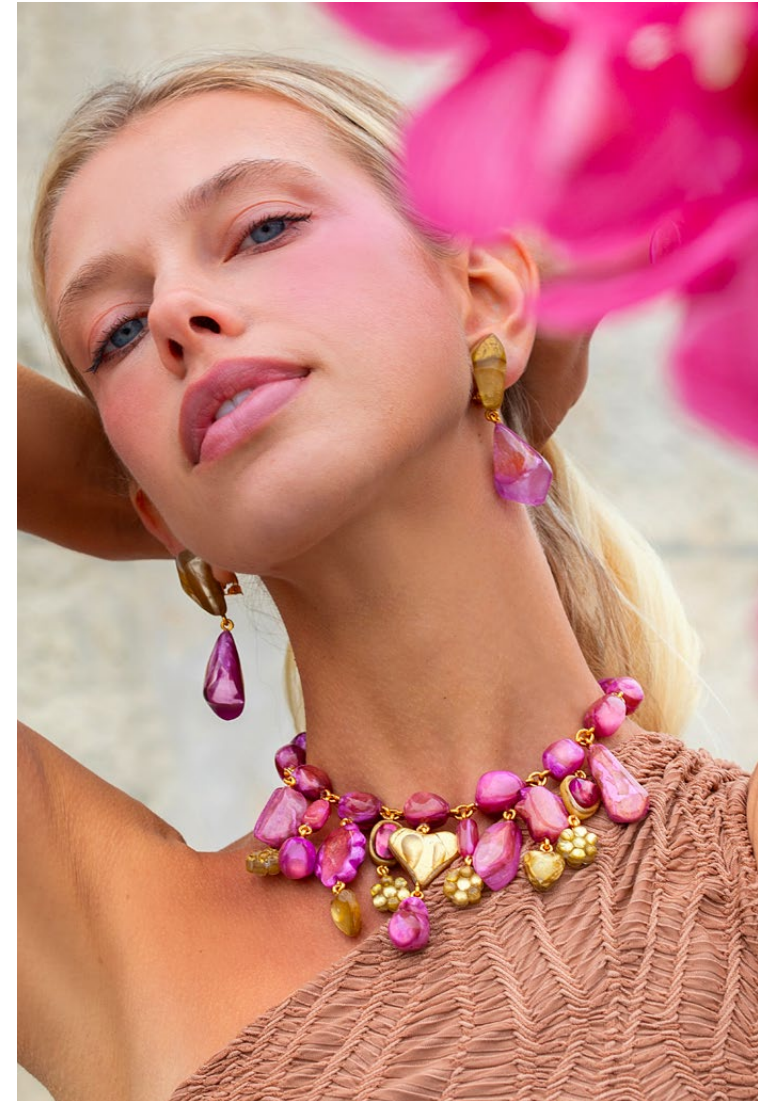
Earrings Ronna / Necklace Berangere /