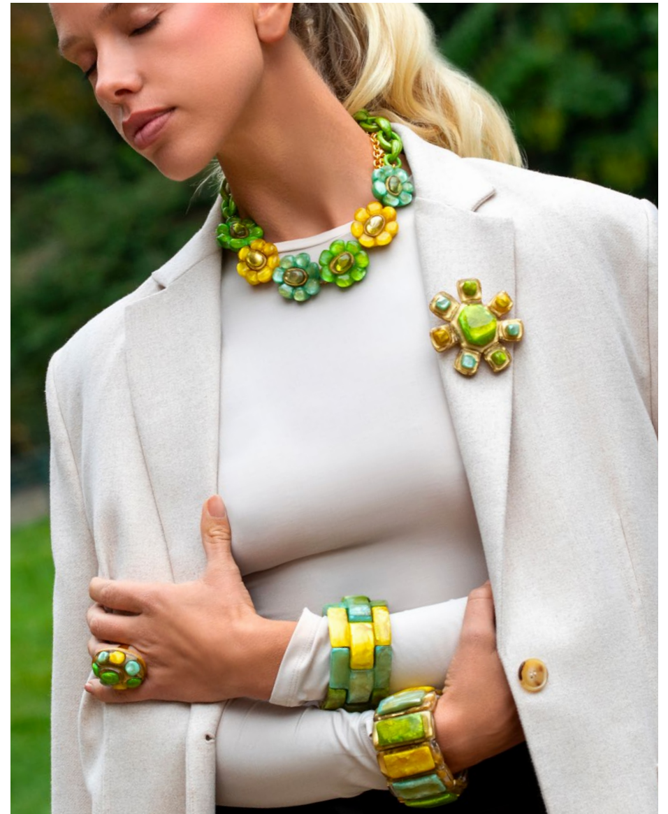
Necklace Daphne / Brooch Inna / Ring Magda Bracelet Gigi / Bracelet Laika /