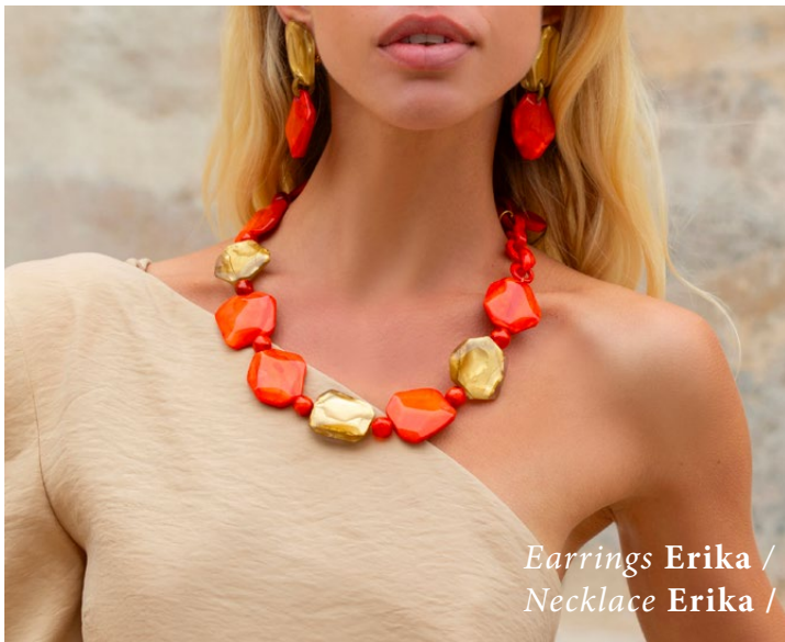
Earrings Erika / Necklace Erika /