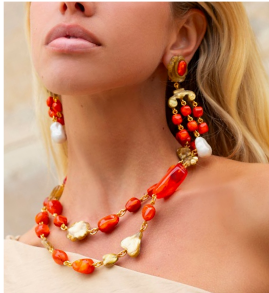
Earrings Brice / Necklace Sofiane /