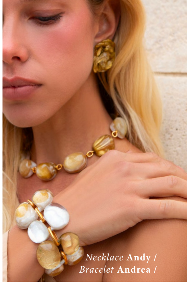
Necklace Andy / Bracelet Andrea /