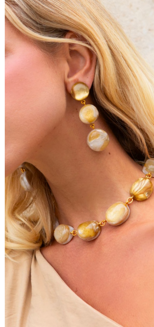
Earrings Lizzy / Necklace Andy /