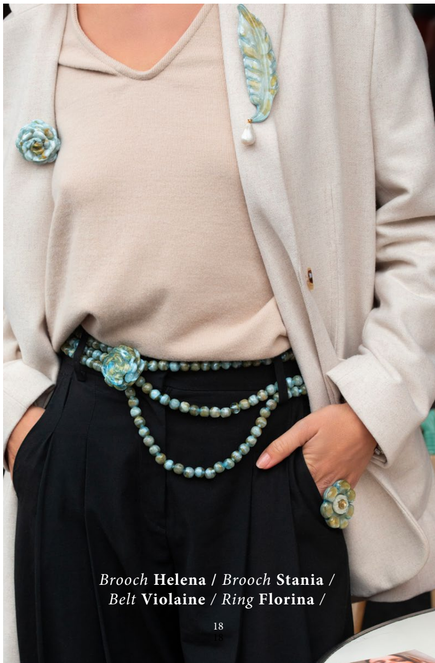
Brooch Helena / Brooch Stania / Belt Violaine / Ring Florina /