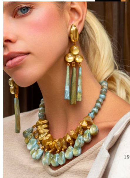
Earrings Prisca / Necklace Brita /