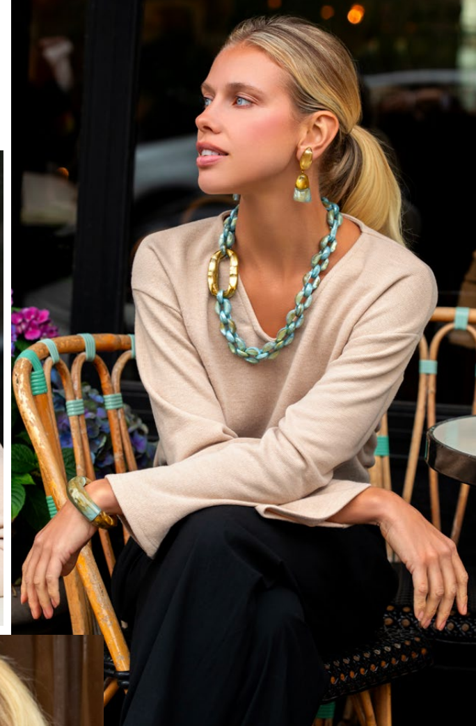
Earrings Iza / Necklace Claude / Bracelet Blanca /