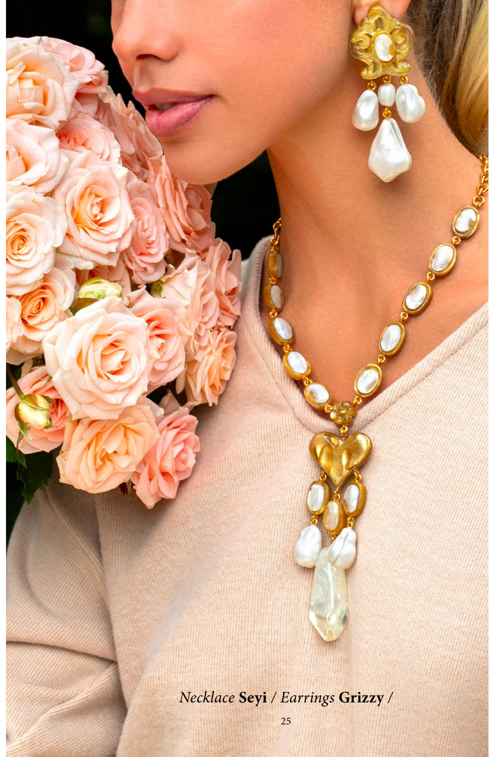
Necklace Seyi / Earrings Grizzly /