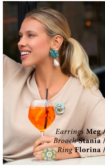
Earrings Meg / Brooch Stania / Ring Florina /