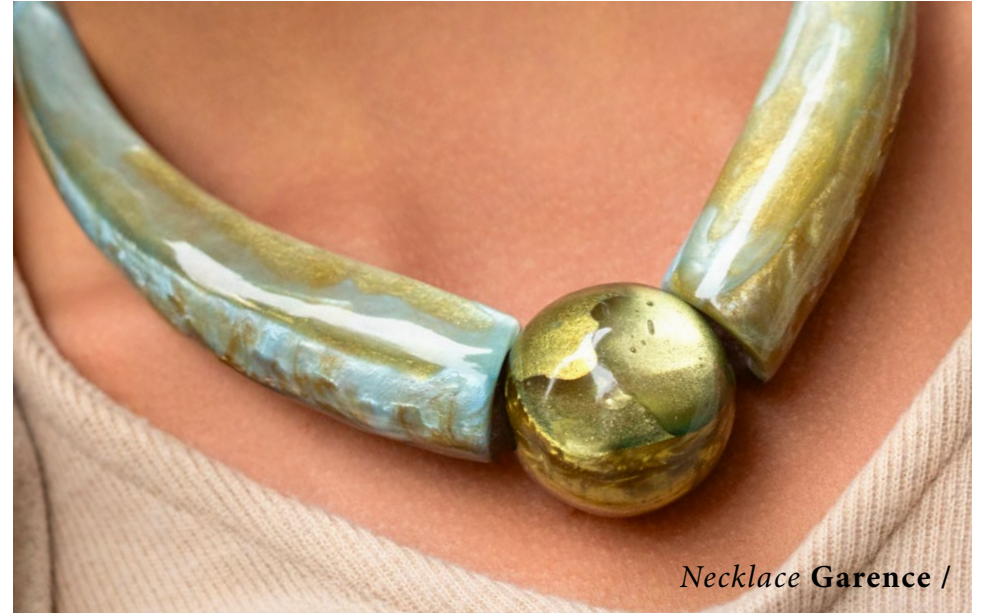
Necklace Garence /