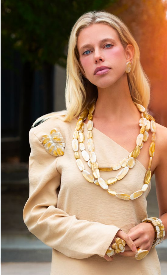
Earrings Dana / Brooch Jamile / Necklace Ophelia / Ring Sia / Ring Milley / Ring Everly / Bracelet Sissy /