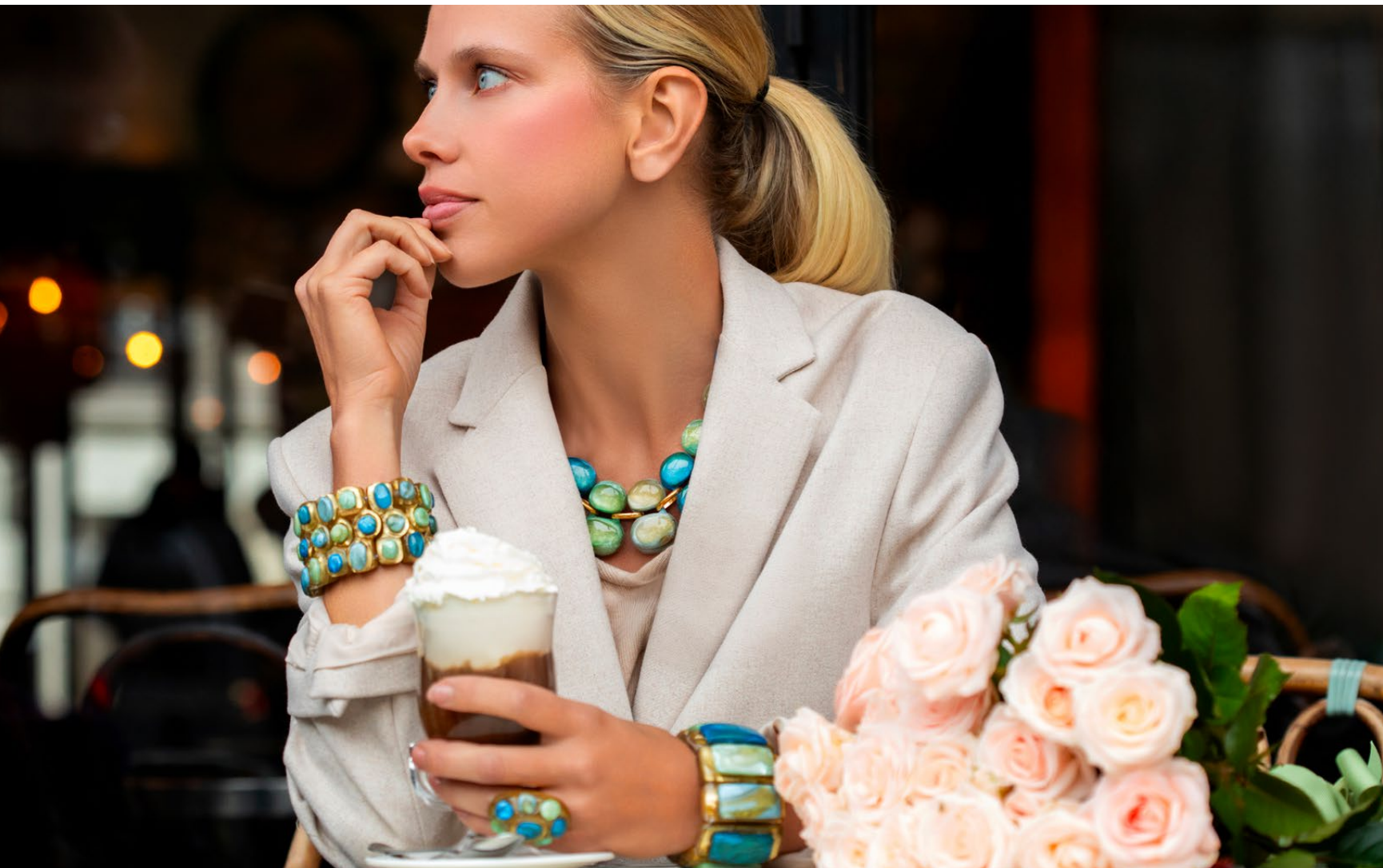
Bracelet Teria / Necklace Andrea / Ring Magda / Bracelet Laika /