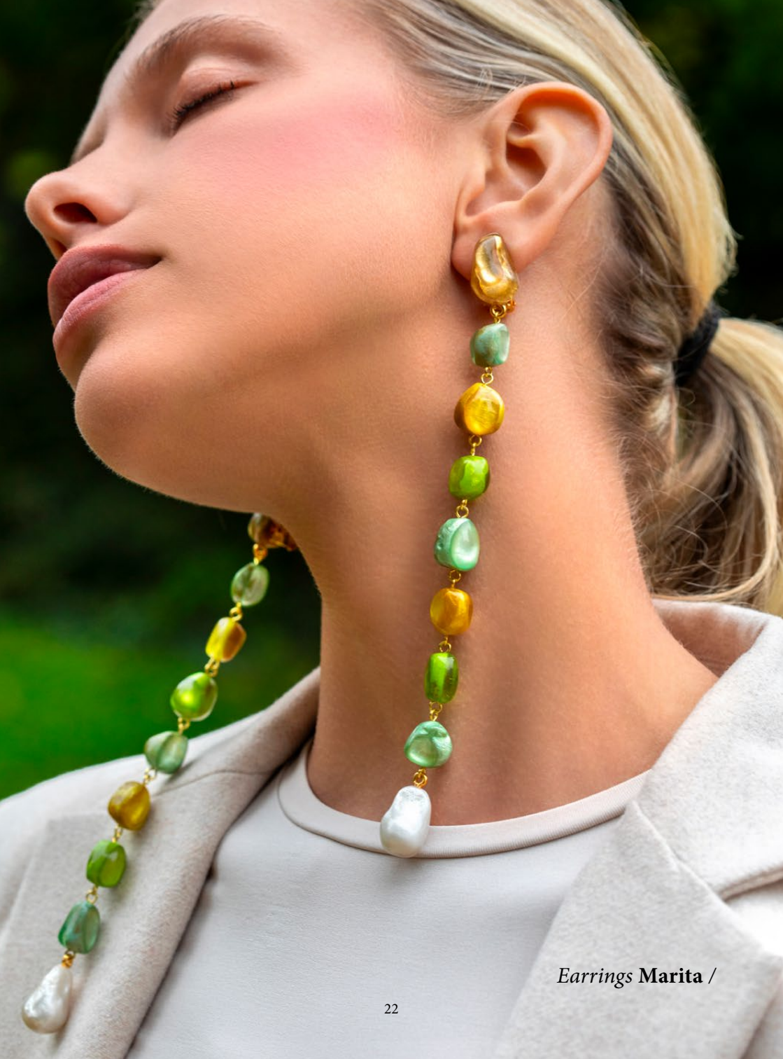
Earrings Marita /