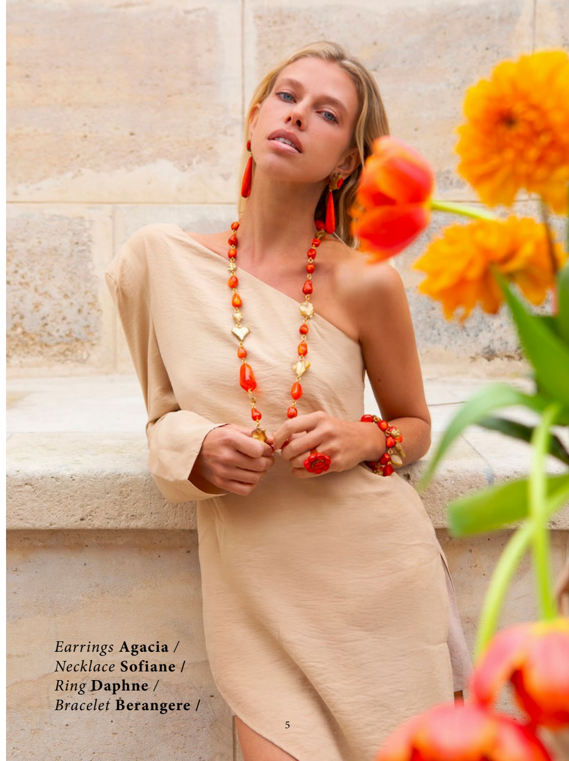
Earrings Agacia / Necklace Sofiane / Ring Daphne / Bracelet Berangere /