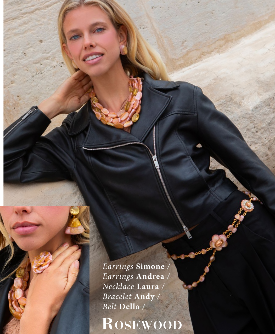
Earrings Simone / Earrings Andrea / Necklace Laura / Bracelet Andy / Belt Della /