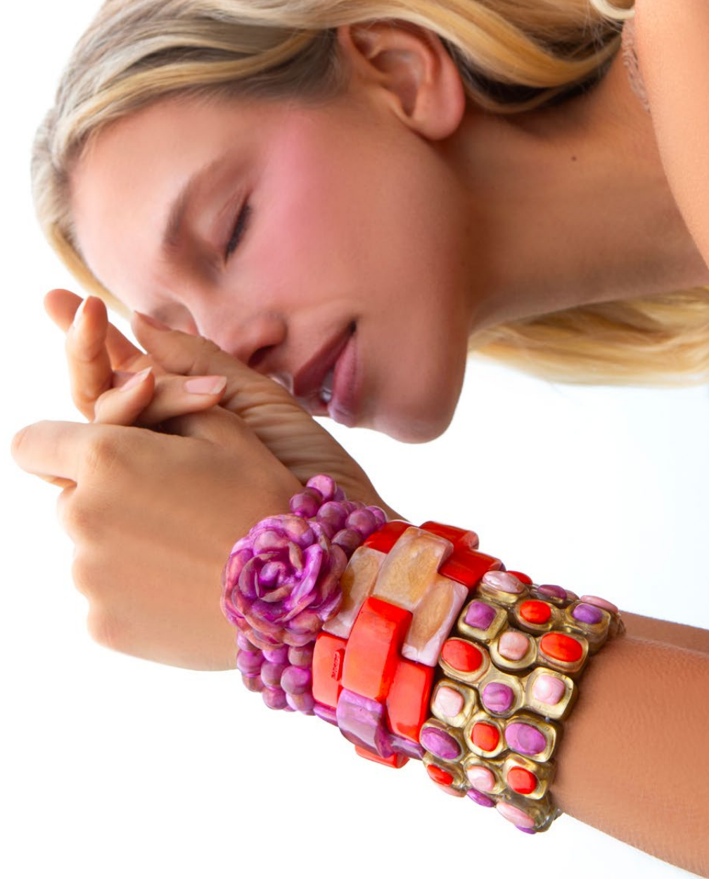
Bracelet Stania / Bracelet Gigi / Bracelet Teria /