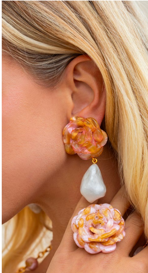
Earrings Meg / Ring Stania /